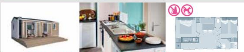
COTTAGE PRIVILÈGE | 4 PERS. | 2 CH. | 29 M 2 | NEUF | QTÉ : 7