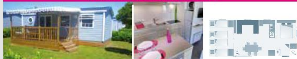
O'HARA | 6 PERS. | 3 CH. | 36 M 2 | A | QTÉ : 8