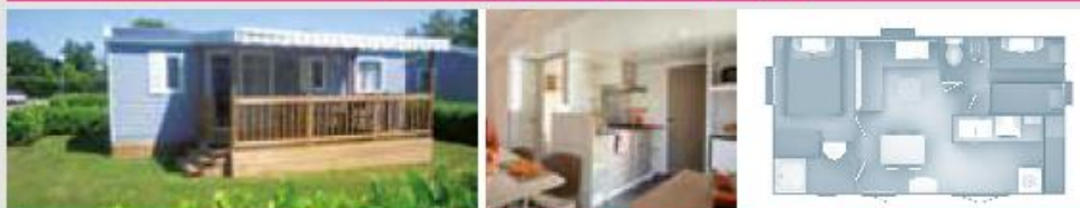
TRIGANO | 4 PERS. | 2 CH. | 29 M 2 | A | QTÉ : 6