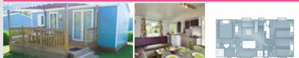
TRIGANO | 6 PERS. | 3 CH. | 36 M 2 | A | QTÉ : 6