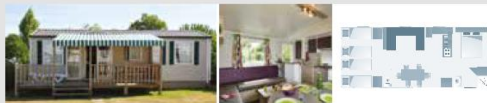
COTTAGE FAMILIAL | 6 PERS. | 3 CH. | 36 M 2 | B | QTÉ : 3

PROMOTION 1 nuit OFFERTE pour tout séjour d'une semaine selon périodes