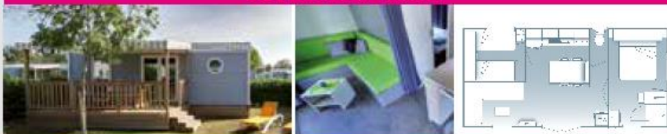
O'HARA | 4 PERS. | 2 CH. | 29 M 2 | A | QTÉ : 4